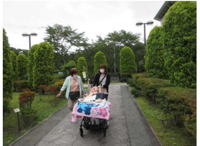
【とても緑が深くて素敵な水道記念館。センターからは少し遠いけど、来られて良かったですね♪】