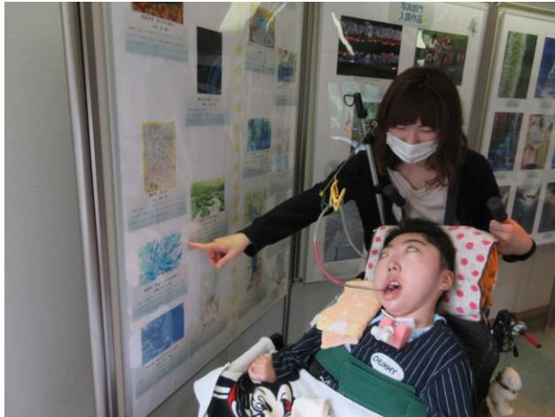
【 かわぐち さん、 ゆび さして おし えて〜】