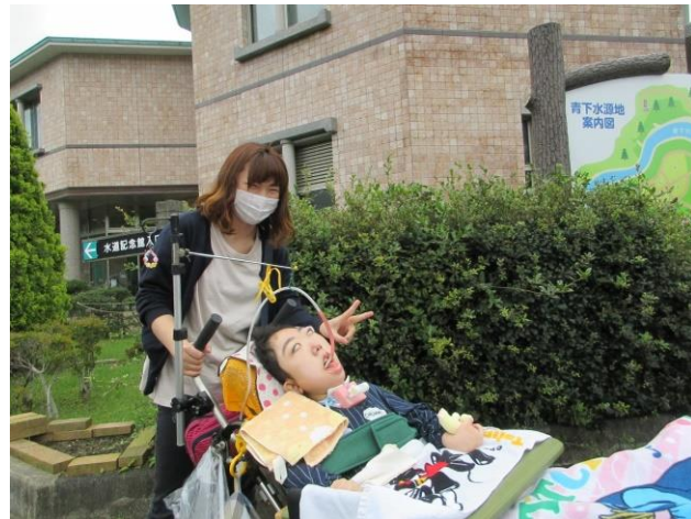
あめ ぱ すいどうきねんかん にゅうかん まえ たてもの いっしょ きねんさつえい 【雨が降っていないので、水道記念館へ入館する前に建物と一緒に記念撮影ができました】