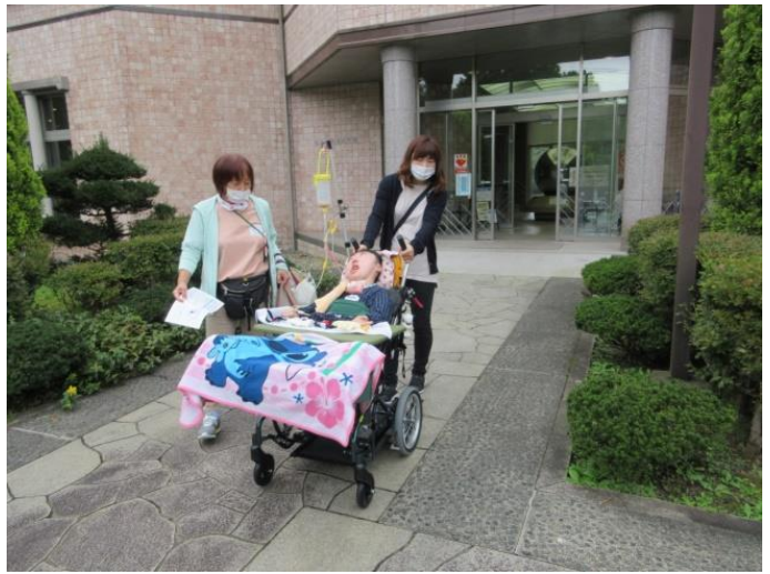
【水道記念館を出る時に受付で、ボトルウォーター「ごくり◇きらり せんだい」を頂きました】